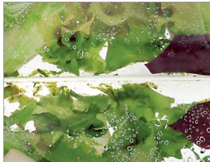
Sellado a través de las zonas húmedas del producto