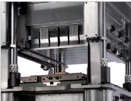
Mesa de sonotrodos con zona de sellado plana