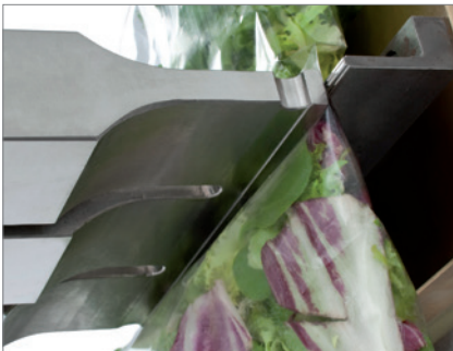
Sistema de sellado ultrasónico para bolsas tubulares

El uso de los ultrasonidos reduce los errores de producción porque el producto en sí no se calienta. Además, el producto en el área de sellado se separa por el efecto ultrasónico durante el proceso de sellado. La calidad de la costura resultante y las capas de barrera de la película de la bolsa no se ven afectadas.