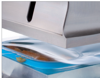
Sellar una bandeja mojada de producto