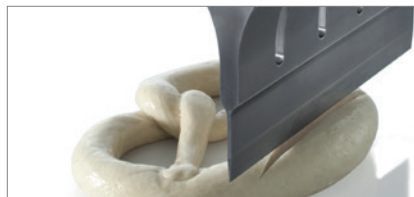
Einschneiden von Brezelrollen nach dem Belaugen

Aufgrund der Ultraschall-Schwingungen arbeiten Schneidsonotroden mit einem geringeren Anpressdruck als herkömmliche Messer. Gleichzeitig ist ihr Verschleiß niedriger und die Schneidqualität deutlich höher. Daneben wirkt sich der Einsatz von Ultraschall-Schneidsystemen positiv auf die Wartungs- und Stillstandzeiten der Anlagen aus.