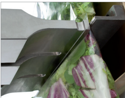
Ultraschall-Siegelsystem für Schlauchbeutel

Die kalten Werkzeuge pressen den Schlauchbeutel zum Versiegeln zusammen. Die Ultraschall-Schwingungen der Sonotroden bewirken dann, dass die Molekülketten im Siegelbereich unter Wärmebildung aufbrechen und sich neue Verbindungen bilden. In kürzester Zeit entstehen Siegelnähte von herausragender Qualität.