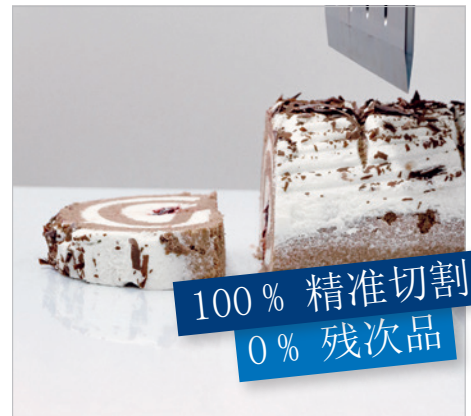
极少粘连产品且具有自清洁效果的超声波切刀

配有换能器、调幅器和焊头的均衡型超声波振动元件，可集成至机器系统中实现精准的食品切割