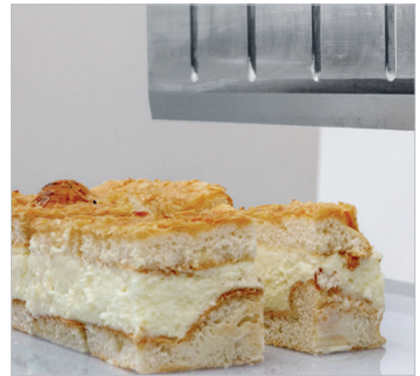
切割外观精美且保持形状不变