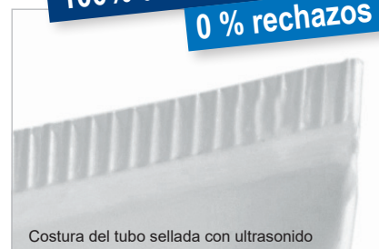
Costura del tubo sellada con ultrasonido