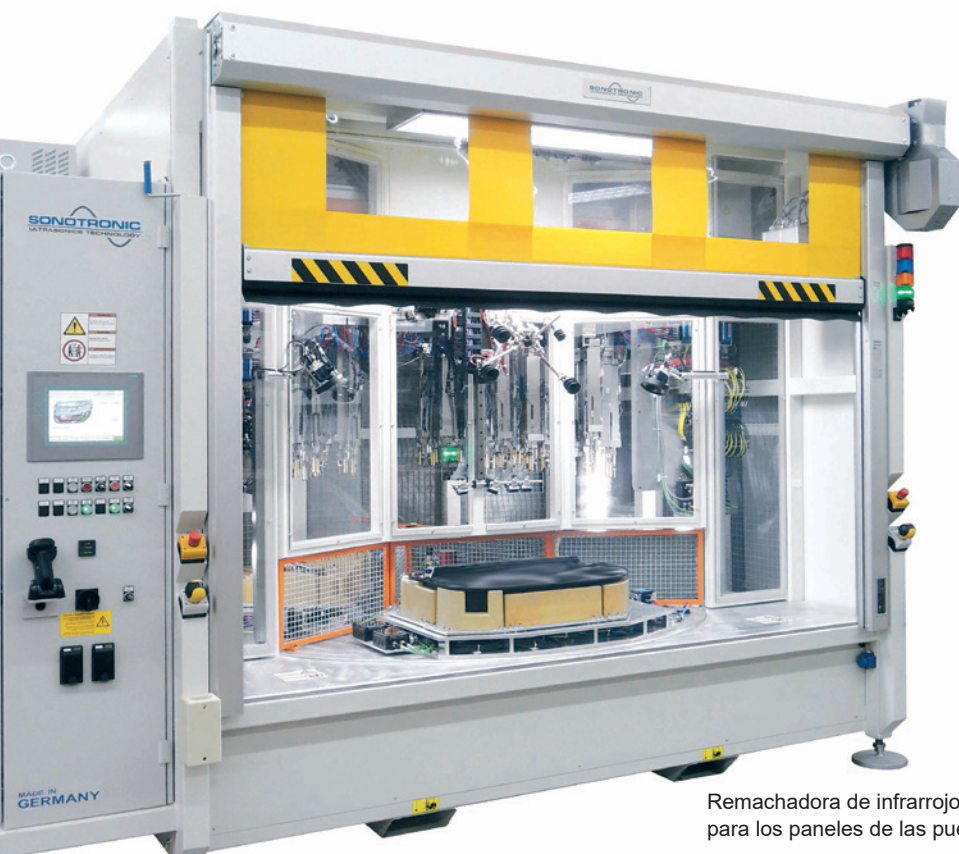
Remachadora de infrarrojos para los paneles de las puertas

Con el ultrasonido y el infrarrojo, SONOTRONIC ofrece ahora dos métodos que se complementan entre sí. Si las propiedades materiales de los componentes lo requieren, las máquinas estándar y especiales están equipadas con unidades de infrarrojos. Además, pueden aplicarse soluciones completas en una combinación de unidades de avance de ultrasonidos e infrarrojos (máquinas híbridas). Un ejemplo clásico de esto son las rejillas de los altavoces hechas de POM, que deben ser insertadas en los paneles de las puertas además de otras partes. El innovador proceso de remachado por infrarrojos ya se está utilizando varias veces en sistemas específicos para clientes en el mercado. Se han realizado tanto máquinas híbridas con ultrasonidos e infrarrojos como máquinas especiales con más de 50 unidades de alimentación de infrarrojos cada una.