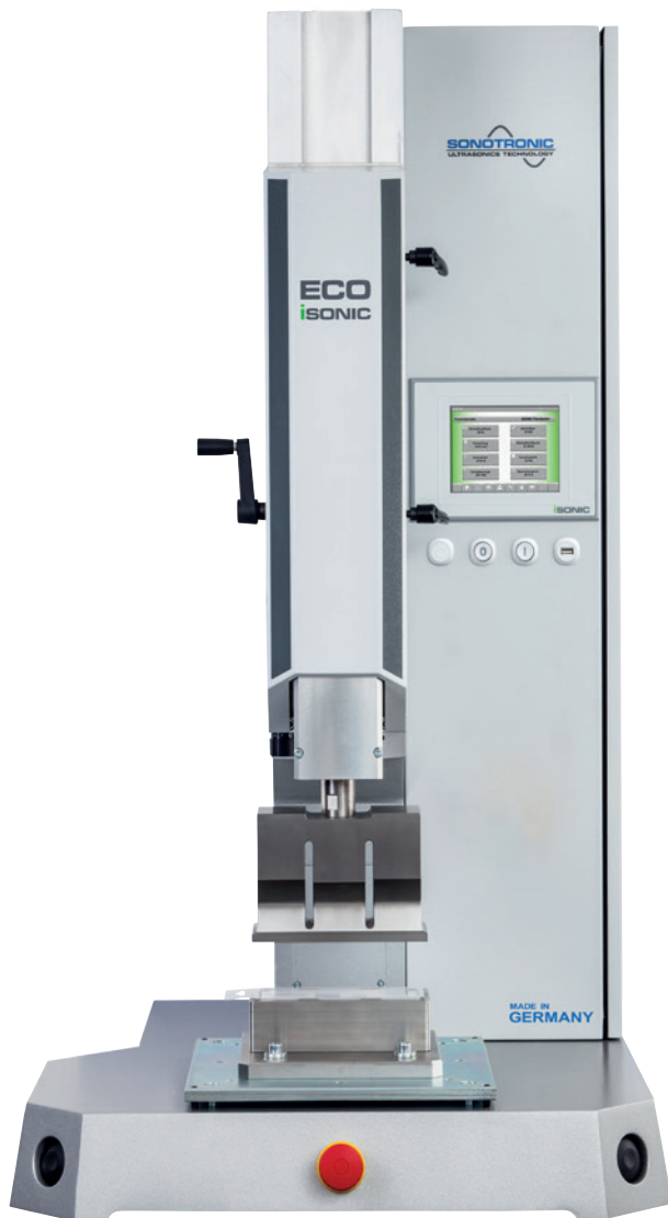
ECO 智能化超声波标准台机